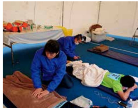
川口マラソン ランナーズケア