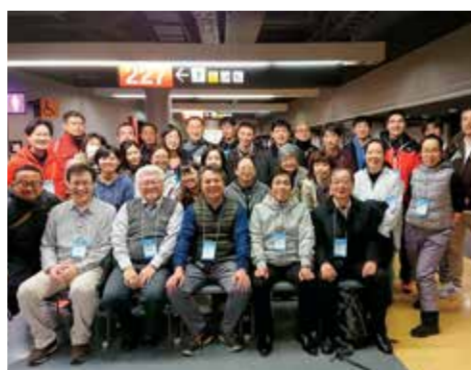
さいたま国際マラソン参加者