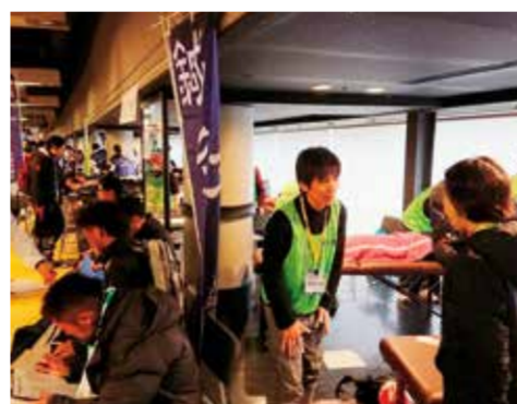
さいたま国際マラソン ランナーズブース