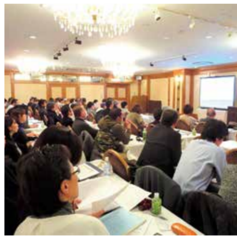
療養費適正運用研修会

平成31年1月27日(日)、埼玉医科大学かわごえクリニックに於いて埼玉鍼灸学会と共済で『平成30年度 第3回学術講習会』を開催しました。