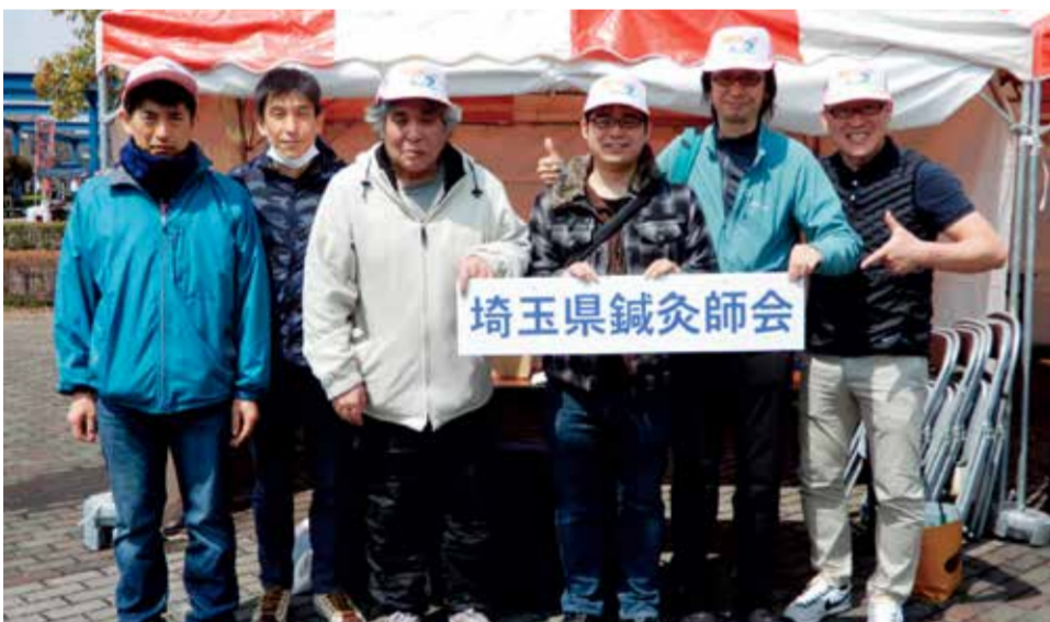
吉川なますの里マラソン 参加者