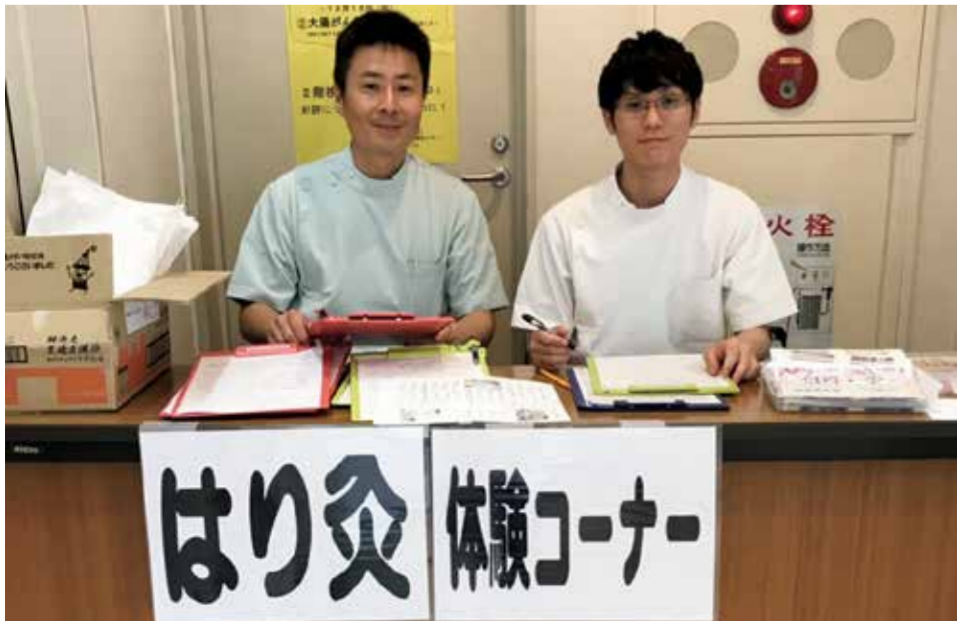
日高市健康まつり

2019年6月9日(日)に開催された日高市健康まつりで118名の方に鍼灸の体験をしていただきました。