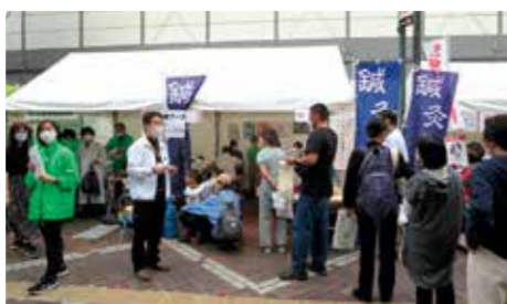
浦和地区健康まつり

浦和区健康まつりが2023年11月5日(日)に開催され、埼玉県鍼灸師会浦和地区が鍼灸体験ブースを出展しました。今回はブースの関係で以前より少ない体験スペースとなってしまいましたが、大人251名に鍼灸を小児45名に小児鍼の体験をしていただきました。