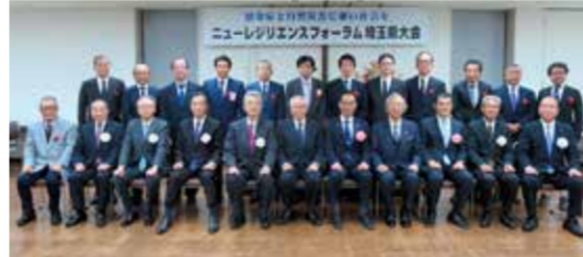
ニューレジリエンスフォーラム埼玉大会

レジリエンスとは「回復力」、「弾性」などの意味があり、この団体は「感染症と自然災害に強い社会を」をスローガンにしています。埼玉県鍼灸師会はニューレジリエンスの「法整備や、医療界・経済界・防災関係・自治体関係をはじめとした多くの人々と力を合わせていく国民運動を推進する」という趣旨に賛同し、昨年から活動に参加しています。